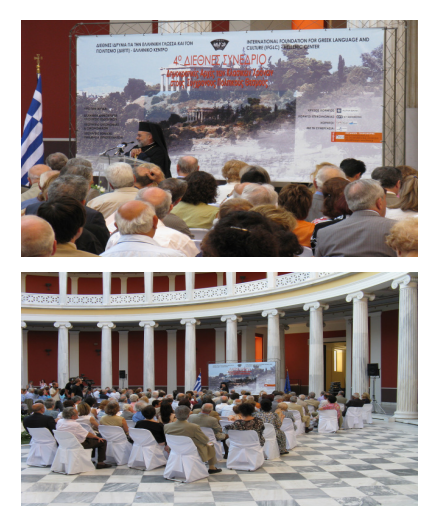
The honorees of the Athens Conference:

Below: Two scenes from the Athens International Conference which was held in the majestic Zappeion Palace.